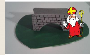
Mathe mit dem Nikolaus