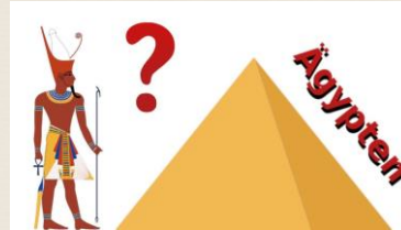
Ein Hilferuf aus Ägypten